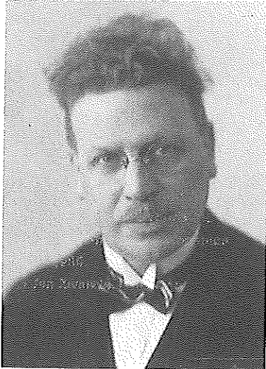
M. Vrijenhoek

Bakker Schut werd in zijn streven naar planmatigheid gesteund door de SDAP-wethouder Machiel Vrijenhoek , die in de periode 1925-1931 wethouder Stadsontwikkeling en Woningbouw was.