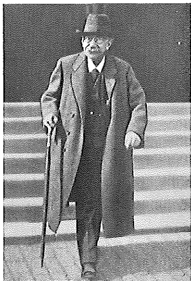
Victor Adler tijdens de Eerste Wereldoorlog.