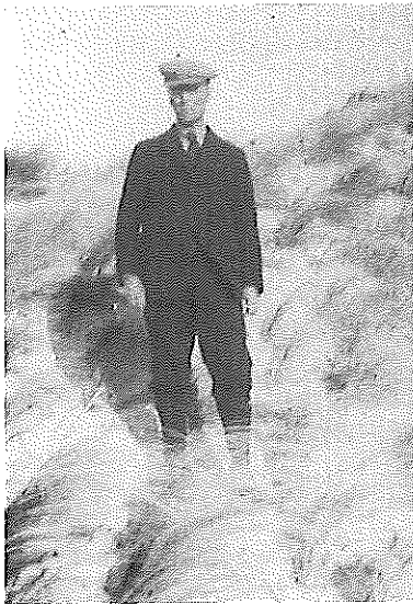
De dichter Herman Gorter in de duinen van Noord-Holland, jaren '20.

1 Malieveld met uitzicht op de Prinsessegracht. Rechts is het gebouw van de Provincie Zuid-Holland. Het Malieveld is de plek waar in het verleden veel demonstraties gehouden werden. Van kiesrechtbetogingen, manifestaties voor het behoud van het koningschap alsook demonstraties tegen het gebruik van kernenergie.