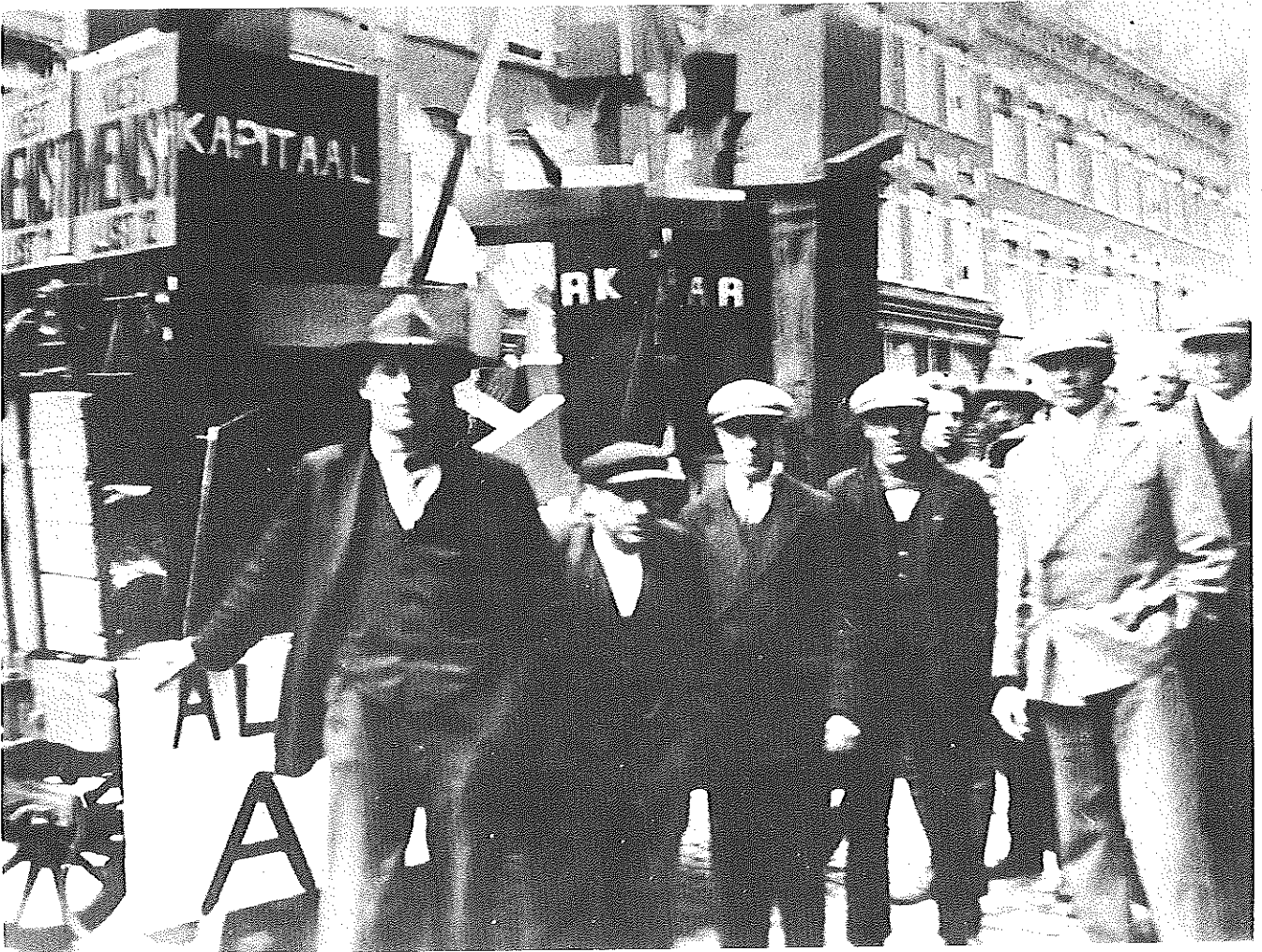
Verkiezingspropaganda voor de RSP in Rotterdam 1935.

Victor Serge is bv. bij ons geweest. Die knaap sprak frans, daar moest je Sneevliet dus weer voor hebben, want dat was de talenknobbel. Hij vertaalde dat. Victor Serge zat begin jaren dertig gevangen in Rusland en hij is door internationale interventie eruit gekomen en toen heeft hij bij ons een lezing gehouden. Er is ook nog eens een duitser geweest, of dat nou Brandler of Thalheimer is geweest dat weet ik niet. Maar het was in ieder geval eentje van de linkse oppositie in de KPD.