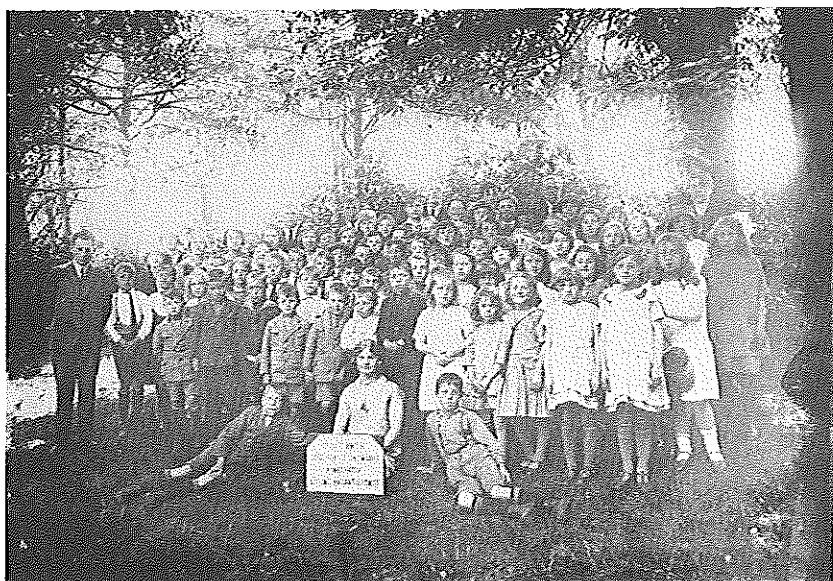
Kinderkoor van de rotterdamse liedertafel "Ontwaakt" in het Sterrebos te Schiedam 1929.

naar hun zou brengen en dan kreeg ik de 35 cent die de bode anders kreeg. Van die 35 cent kon ik naar de mandolineclub. Het hield wel in dat mijn moeder zich veel moest ontszeggen. Ze kon zichzelf geen japon veroorloven, dus ze liep altijd in een schort. Het leven was toen erg sober.