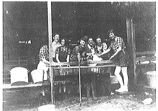
Links: pinksterkamp van de LJG in het Ferdinand Domela Nieuwenhuisoord 1936. Rechts: pinksterkamp van de LJG in 1938.

Kunt u iets vertellen over de Leninistische Jeugd Garde?