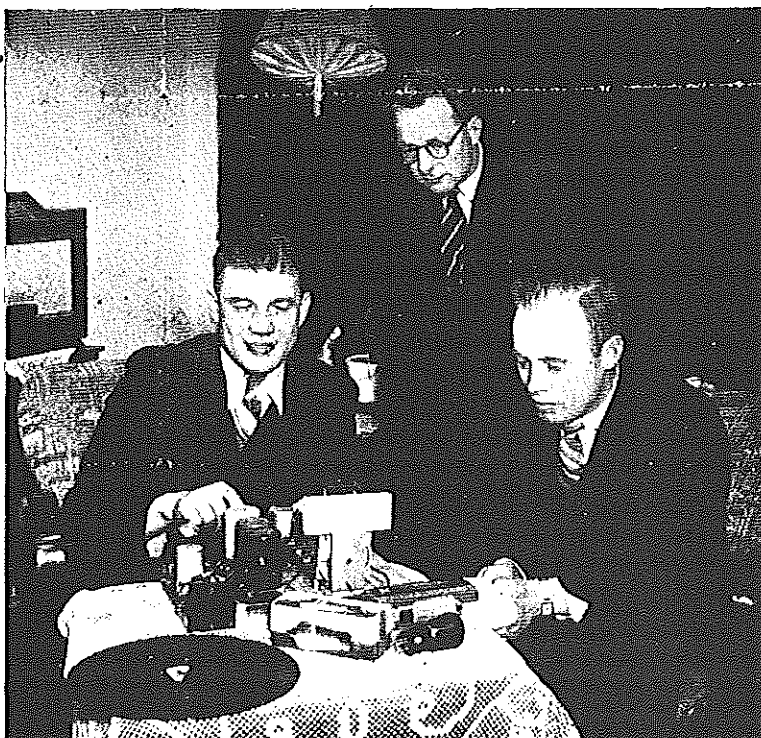
De Aetherpiraten die thans weer „vrij“ zijn! Beramen zij nieuwe plannen?

Het was „De Maasbode“ die de jongens van „De Rode Omroep“ betitelde als „de Aetherpiraten“. Deze laatsten hebben ons verzekerd, dat ze geen aanklacht tegen „De Maasbode“ zullen indienen voor deze belediging. Zij zijn bereid deze titel te aanvaarden, Rovers van de aether, dat is een merkwuurde benaming. De aether is het eigendom van ieder, zij bevindt zich overal, toch zeggen de heersers, de aether is van ons. Zoals zij over het leven van de mensen beschik-