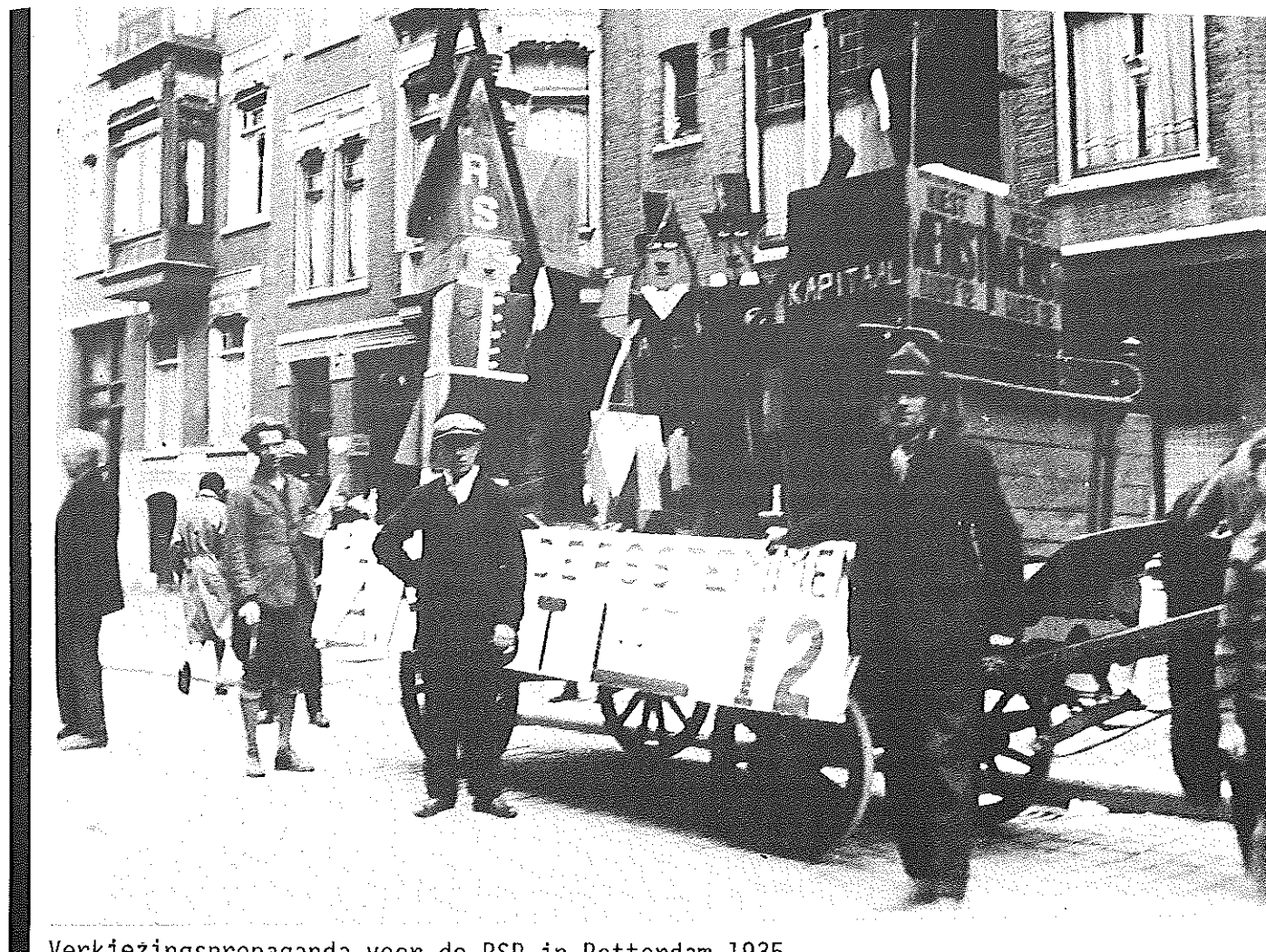
Verkiezingspropaganda voor de RSP in Rotterdam 1935.

Lenin de mensen aan het denken te brengen dat de lijn van Stalin anders was dan van Lenin.