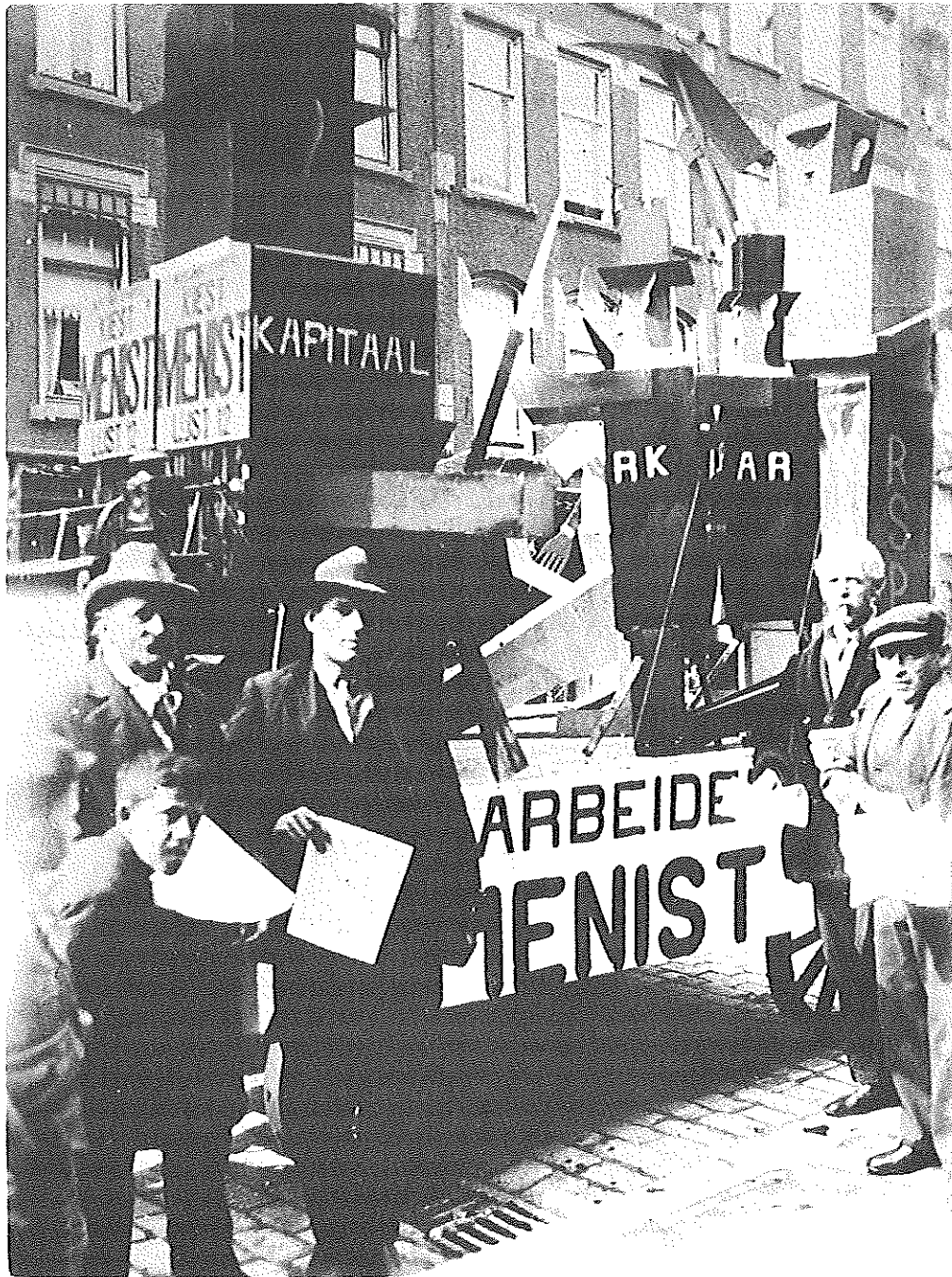
Verkiezingspropaganda voor de RSP in Rotterdam 1935.