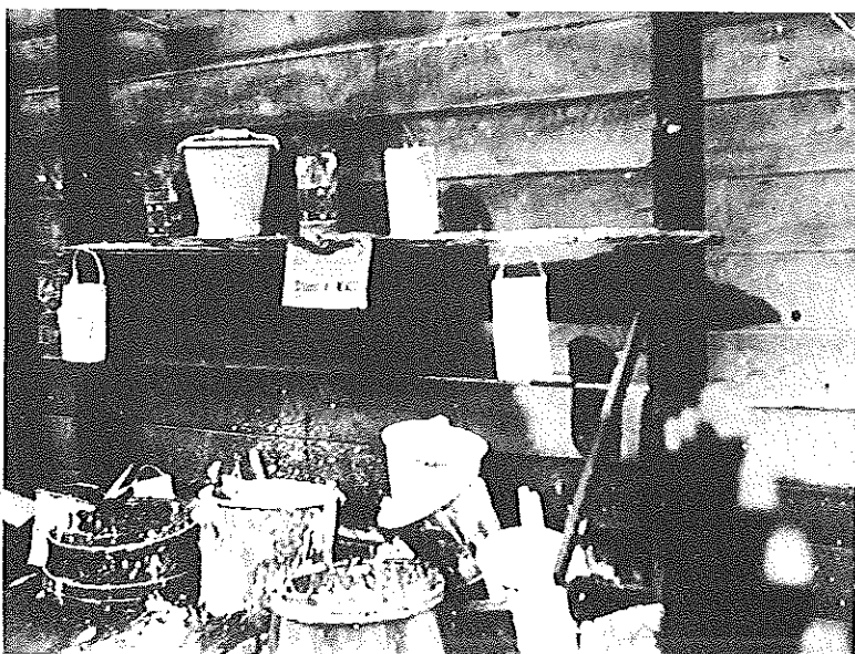
Stilleven van kalkemmers. Er werd gekalkt voor de kandidaat Menist.

Nou nee, dan gingen we naar huis. We kolporkeerden van zeven tot half tien. Je had toen een heel ander leven. De mensen hadden nog geen radio en tv. Ze zaten buiten op hun stoepjes en dan begon de discussie. Dan moest je weleens oppassen, want dan gin- gen ze met je staan praten zodat je geen kranten meer kon verkopen. Wij keken daar wel voor uit. Je kon het aan de dingen die ze aan je vroegen horen. Dan zeiden we: "Met jou praat ik niet verder. Ik ga door met kolporteren."