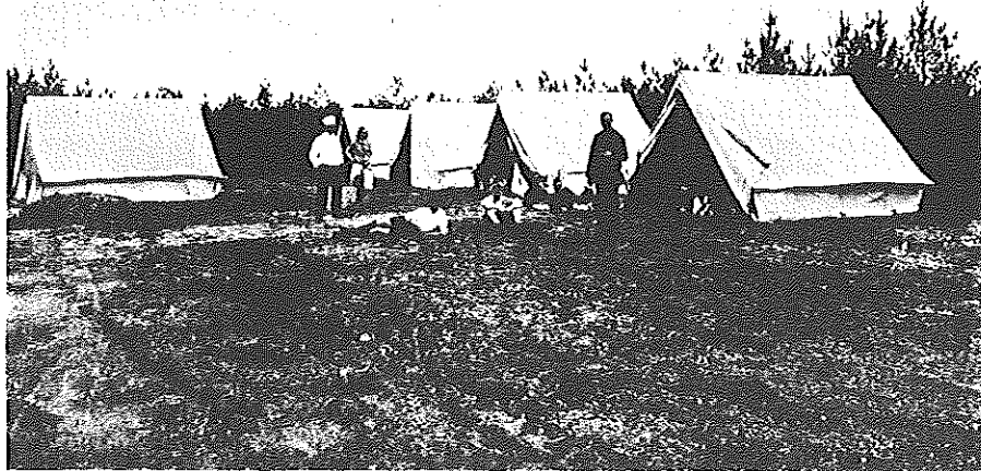
Ferd Domela Nieuwenhuis-Oord, Beekbergen. Slaapterrein met tenten