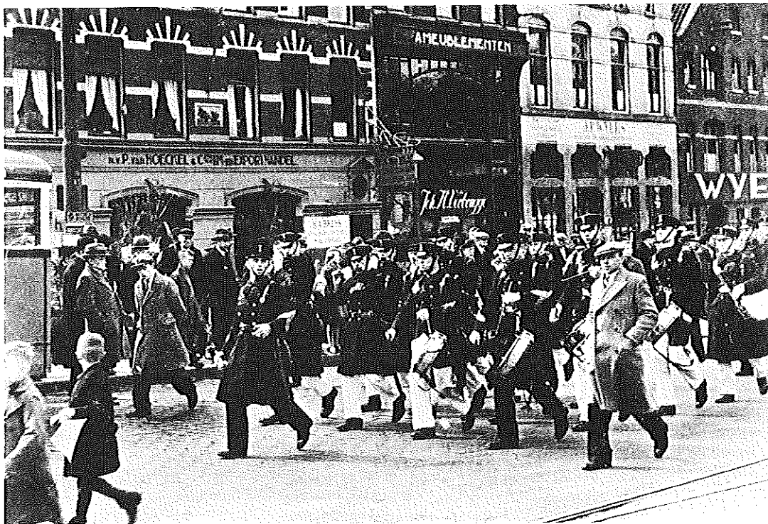
Mariniers op de Goudsesingel.