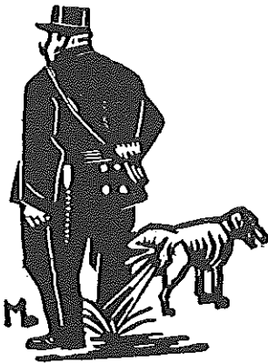
Prent Frans Masereel.

hadden ze een witte verschijning gezien, maar het was een hoerenbuurt die Schiedamsedijk, dus ze moesten klanten hebben. Dus het moest een beetje drukker worden. Uitgekookt hè. Maar het werd zò erg dat de politie eraan te pas moest komen want er was geen verkeer meer mogelijk, zo druk was het. Dan werd je de stegen ingeslagen en van de andere kant, de Leuehaven, kwamen ze ook en dan werd je van de Leuehaven weer naar de dijk teruggeslagen.