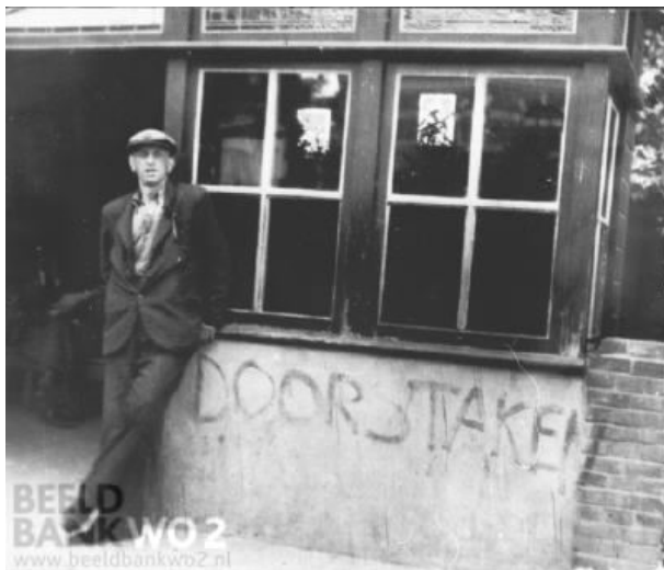
Figuur 1 Staker in de April-meistaking 1943