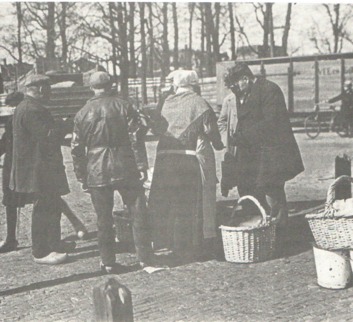
Verkoop op de leidse veemarkt

De mensen waren moedeloos en apaties, waarmee we op de onvermijdelijke vraag komen of ze het allemaal maar namen en over zich heen lieten komen.