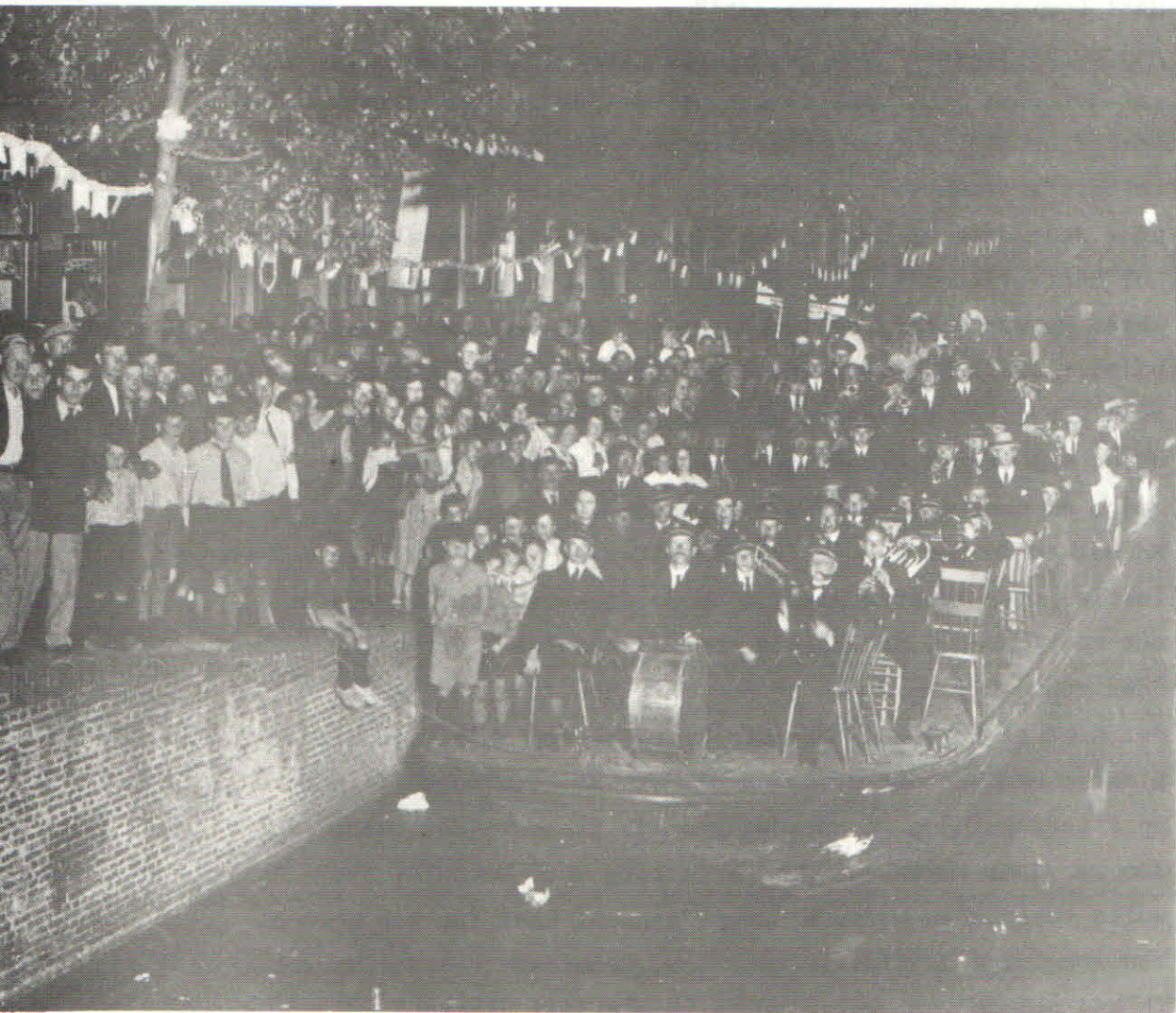
Zo'n demping dient gevierd te worden