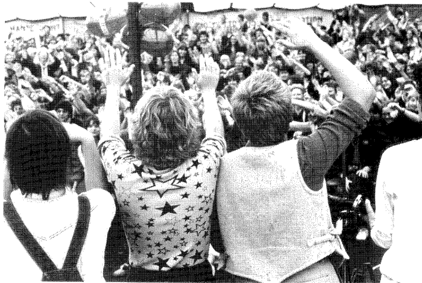
WVE-manifestatie 27 sept '80